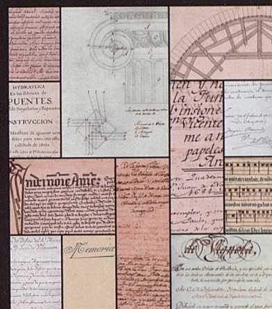
MUESTRA: MANUSCRITOS DE LA BIBLIOTECA DEL COAM

www.coam.org / Biblioteca / Manuscritos de la Biblioteca del Coam